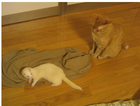
図 1.2 適当なサンプル 2